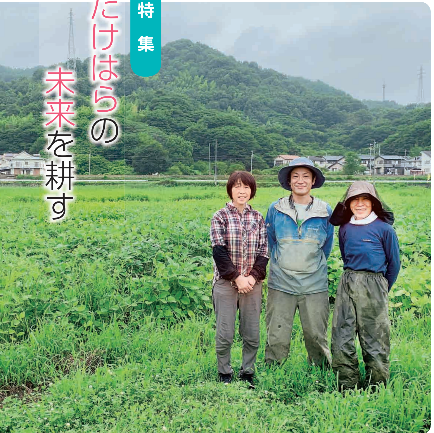
▲高崎町で農業を始めた「一笑農芸」の皆さん