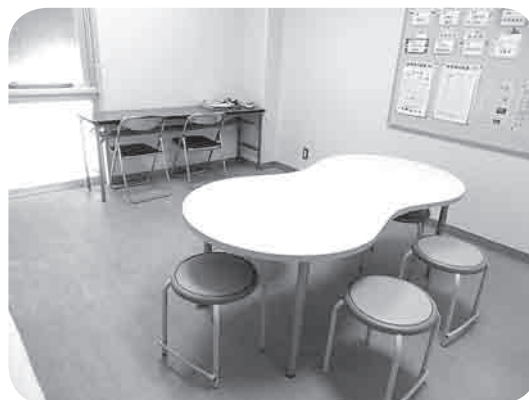
▲忠海小学校のスペシャルサポートルーム