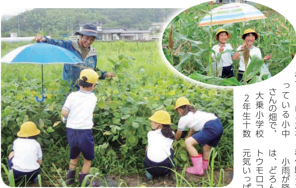
▲雨でもへっちゃら!!

7月10日、安心・安全な食 材づくりにこだわ っている小中 さんの畑で、 大乗小学校 2年生十数 名が生活科の授業で野菜の収 穫体験をされました。 小雨が降る中、子どもたち は、どろんこになりながらも、 トウモロコシや枝豆の収穫に 元気いっぱい。その場で生の トウモロコシ を食べて、甘 くておいしい と喜んでいま した。無農薬 の畑にはトン ボが飛んでい ました。 竹原市に定 住を希望する 若者にとつて、 地域とのつな がりが大切で あると感じま した。 松本 進