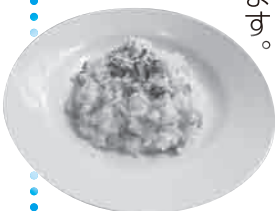
▲旨味と香りが際立つ絶品枝豆リゾット