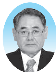
宮原 忠行 議員