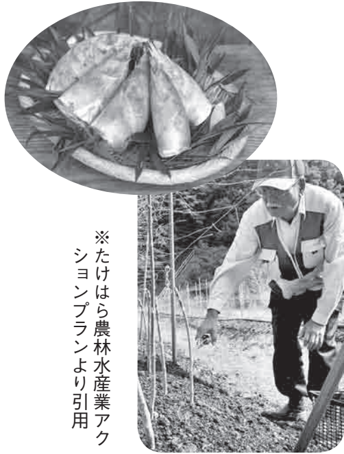
※たけはら農林水産業アクションプランより引用

委員からは、販路の拡大、6 次産業化の推進、中でも「小吹のたけのこ」のような希少価値というブランド品をもっと前面に打ち出してはどうかとの声もあり、本プランの概要にもある「たけはらえーもん」の活用を強化することにより、新たな農林水産業の就業者を増やしていく事に繋がるのではとの意見がだされました。今後においても人口減少に負けない農林水産業を目指し、また我々、委員会も研究・勉強していきます。