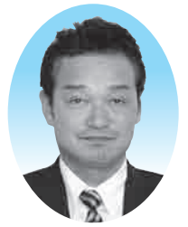
高重 洋介 議員