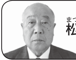
まつもと 松本 すすむ 進

質問 蓋を設置している市道側溝の道路雨水の排水機能はどのように管理していますか。