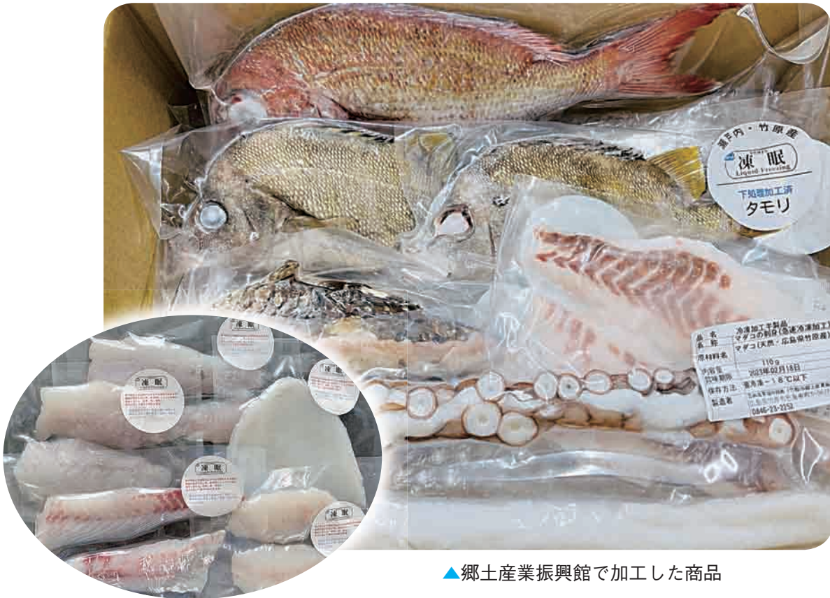
▲郷土産業振興館で加工した商品