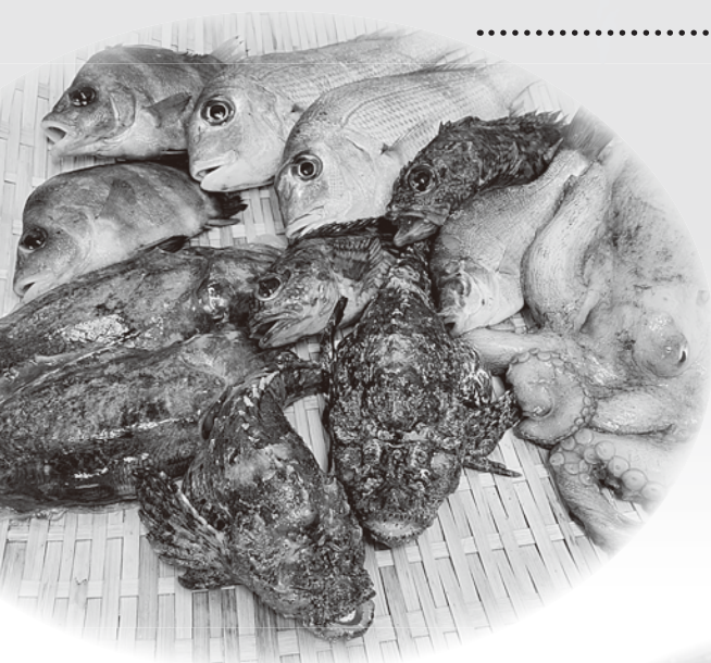
▲竹原市近海で獲れた鮮魚▶

瀬戸内、竹原には大変美味しい食材がありますので、その食材を活かした加工品販売、付加価値をつけた竹原産の鮮魚の販売、販路開拓に益々力を入れて、取り組んでいこうと考えています。