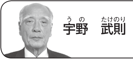
たけのり 武則 の う 野 宇