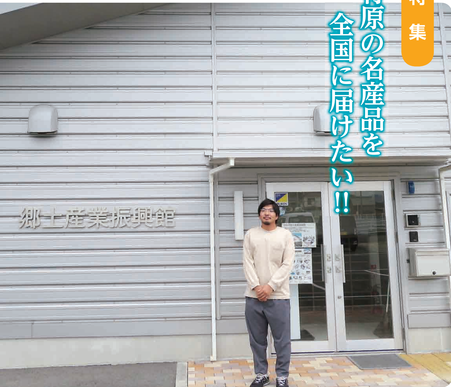
▲郷土産業振興館のスタッフ