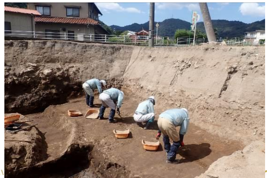
水田跡の調査風景