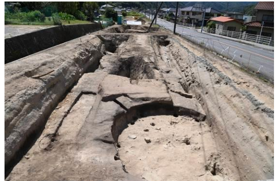
竪穴建物跡などの検出状況