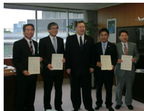
平成24年(2012)6月6日認定式