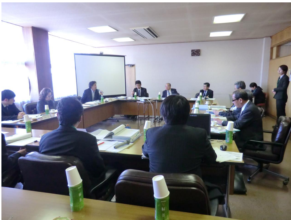
平成24年(2012)3月29日 第1回竹原市歴史的風致維持向上計画協議会（竹原市庁舎 3階 第2委員会室）

計画案を基に「竹原市歴史的風致維持向上計画協議会」で協議を行い、パブリック・コメントによる市民意見の聴取を経て策定した。