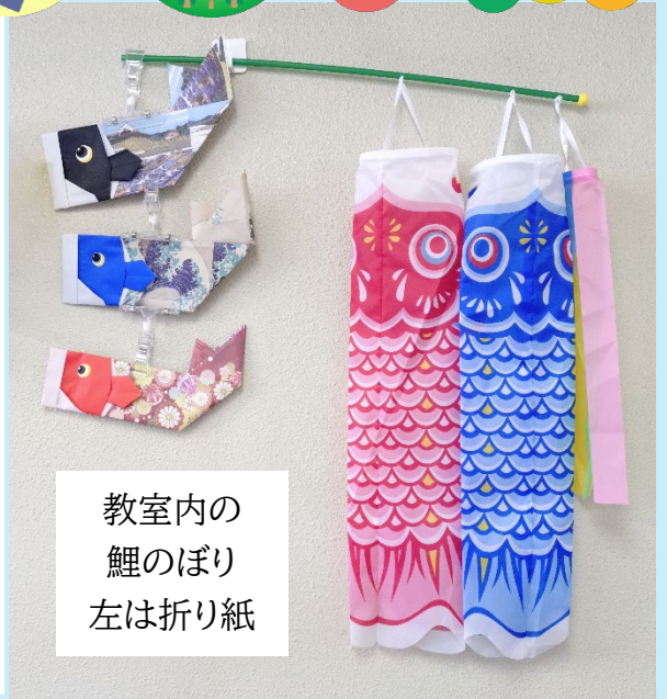
教室内の 鯉のぼり 左は折り紙

ただ、この通信を読んでいる頃には、GW が終わってしまっているでしょうから、GW 疲れを学校の行事や勉強(試験勉強)、クラブ活動、友達との交遊などを通して少しずつ回復し、徐々に学校生活に慣れていくようにしましょう。