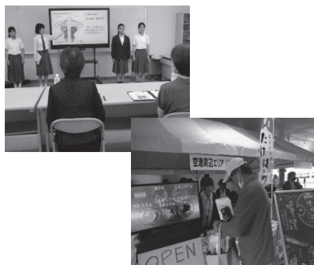
忠海学園（学習活動の様子）

生徒は、自分たちの学習や取組が学校運営協議会 委員や地域に支えられながら実践できたことに大きな達成感を感じていた。