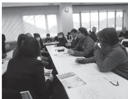
コミュニティ・スクール推進に向けた研修 (令和6年度「地域とともにある学校づくり」実践交流会)

学校運営協議会委員のさらなる当事者意識の涵養とコミュニティ・スクールの深化・発展を図るため、教職員や学校運営協議会委員を対象とした実践交流会等を実施してきた。