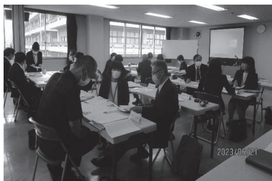
幼保小連携推進協議会の様子

市内の認定こども園、小学校及び義務教育学校の所属長等を対象とした協議会を年に2回実施している。各ブロックでこれまでの取組を交流し合い、カリキュラムを共有した。今後も、各ブロック単位で効果的な研修ができるよう、研修形態の工夫・改善を行う。