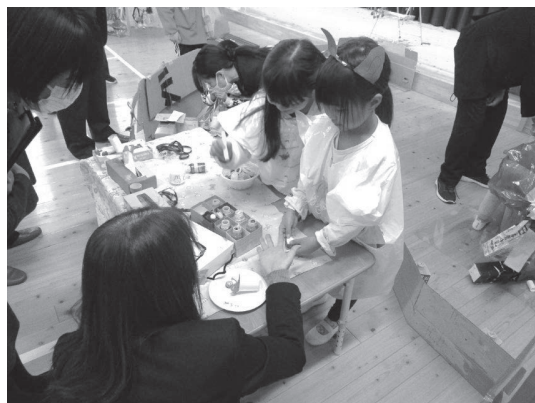
こども園での保育参観の様子

園・所等の教育・保育と小学校及び義務教育学校の教育においては、それぞれの段階における役割と責任を果たすとともに、それぞれの教育・保育の違いを踏まえ、小学校及び義務教育学校に入学した全ての子供が、園・所等での遊びや生活を通した育ちと学びを基礎としながら、安心感を持って新しい学校生活に円滑に移行し、自己を発揮し成長していくために、子供の育ちと学びの連続性を保障することが大切である。