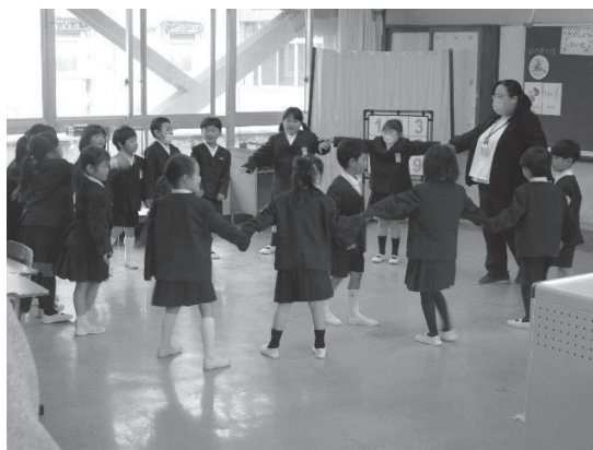
第1学年スタートカリキュラムの様子

小学校及び義務教育学校前期課程において、年度当初からスタートカリキュラムを実施している。4月から5月にかけて、認定こども園等、小学校及び義務教育学校の管理職・担当教員を対象とした研修を行い、実際の子供たちの姿を通して協議を深めることができた。今後2月から3月にかけて、認定こども園の保育参観を通した研修を実施する予定である。