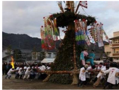
神明祭、祇園祭など祭事の風景