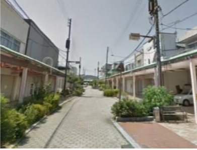
商店街や駅の風景