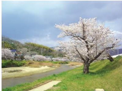
賀茂川等の水辺の風景