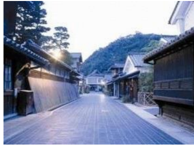
歴史的なまちなみ