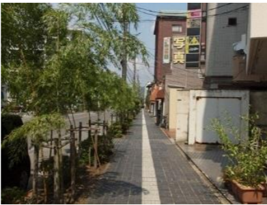
幹線道路沿道の景観 (竹並木、黒レンガ舗装)