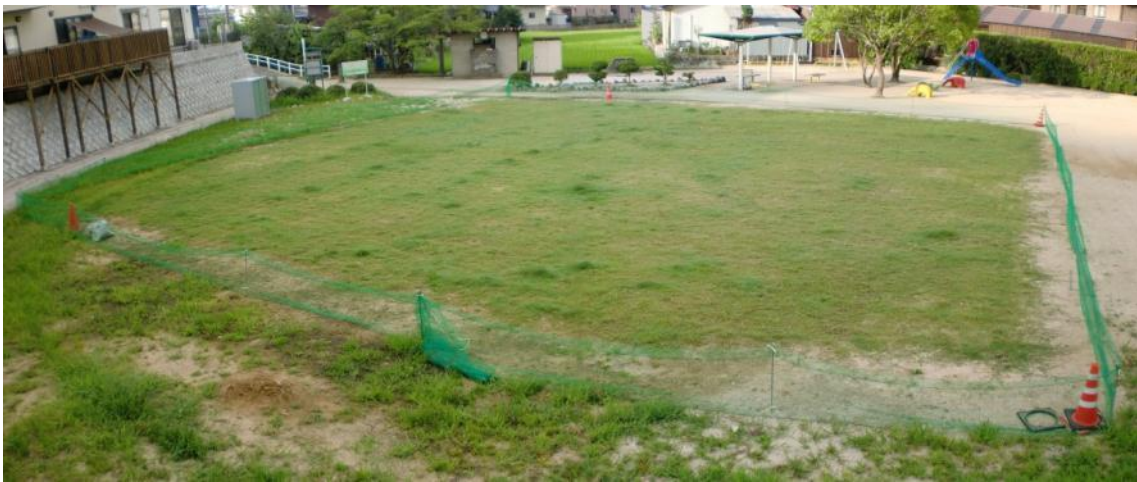
2か月経過（平成22年8月中旬撮影） 全体に広がり、順調に育ってくれました