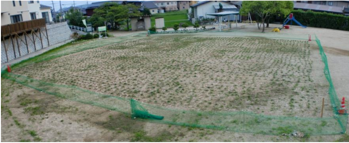
10日経過（平成22年6月下旬撮影） 遠くからは目立った変化はありませんが・・・