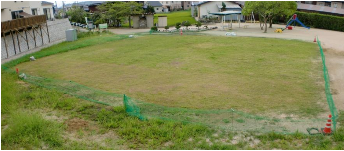
80日経過（平成22年9月初旬撮影） 今年は暑さの影響か、芝刈りの回数が少なくてすんだように思います