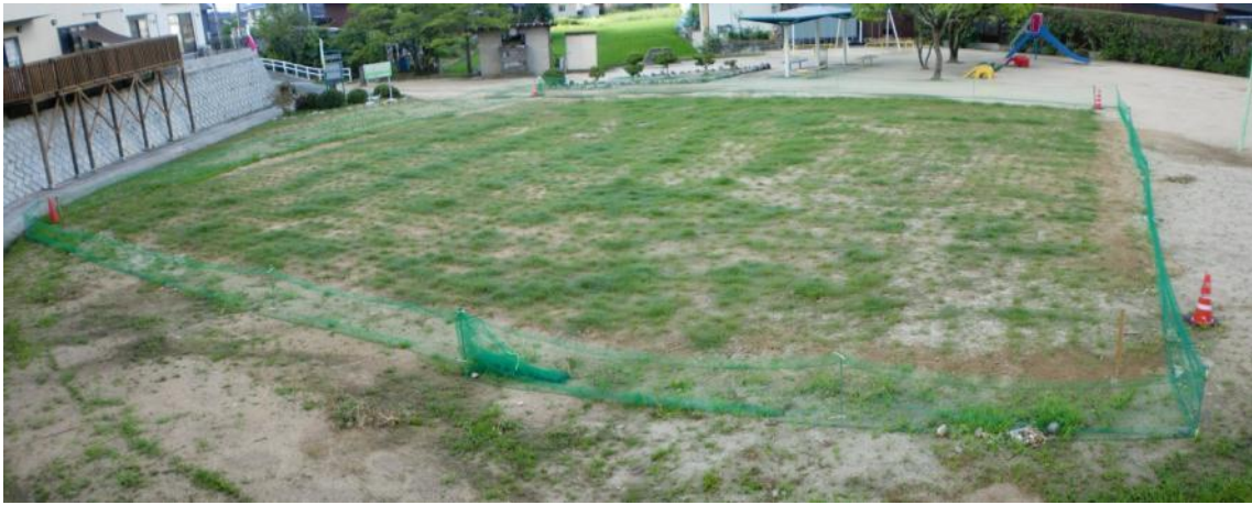
1か月経過（平成22年7月中旬撮影） 芝生もどんどん伸びてきています