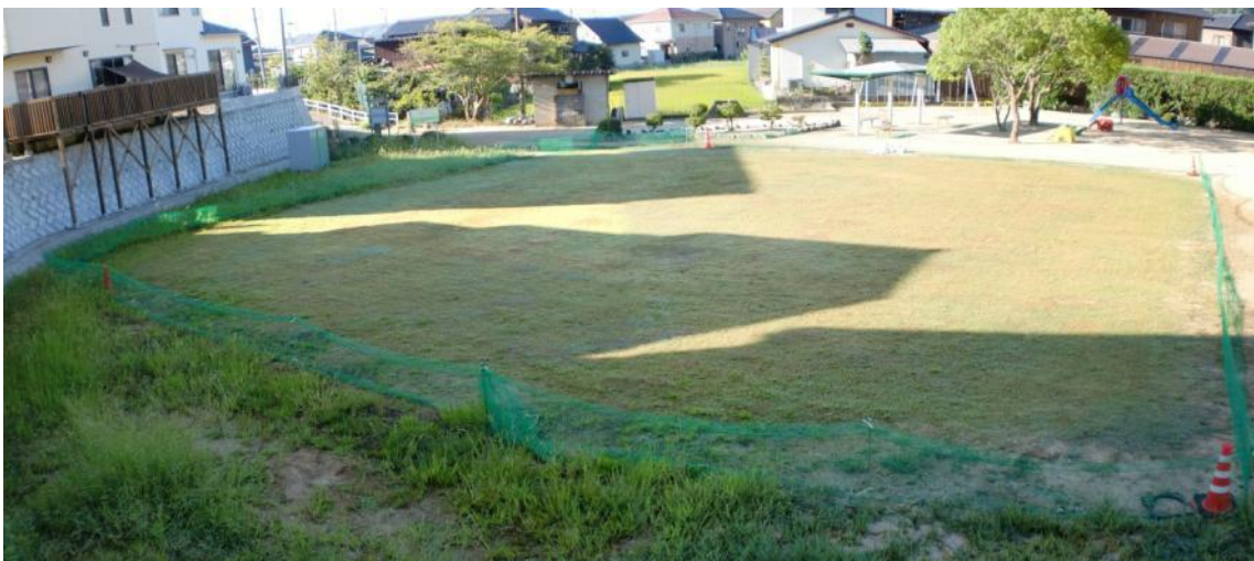
3ヶ月経過（平成22年9月中旬撮影） 成長も初期に比べ落ち着きました