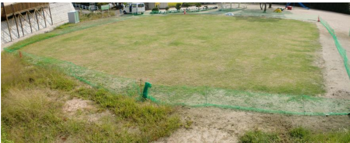
110日経過（平成22年10月上旬撮影） みなさんのおかげでここまで育てることができました