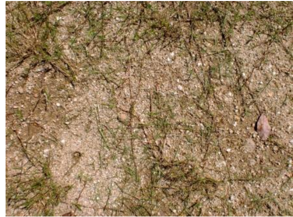
ランナー(茎)がどんどん密になっていることが確認できます