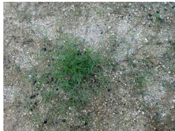
近づいてみると、横に広がっているランナー(茎)が確認できます