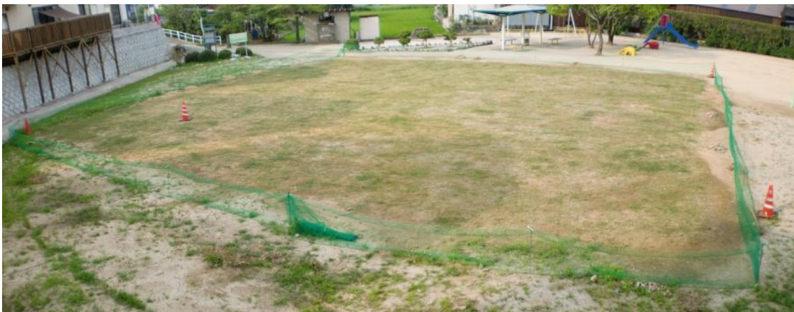
40日経過（平成22年7月下旬撮影） 1か月以上経過し、芝生も伸びたので第1回目の芝刈りをおこないました