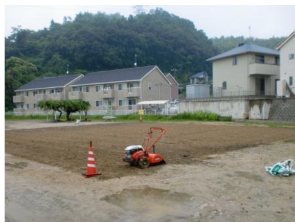
事前準備 芝生の成長促進のため肥料を撒いた後、機械で土をほぐしました