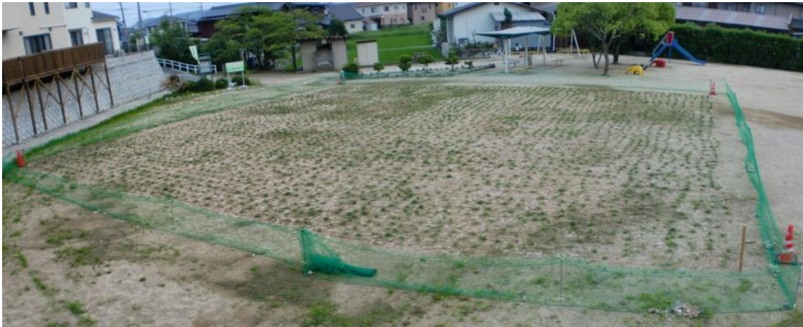
6日経過（平成22年6月25日撮影） まだ目立った変化はありません