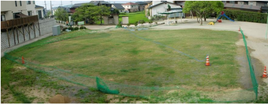
50日経過（平成22年8月上旬撮影） この夏はとても暑かったので、散水をこまめにやっていただきました