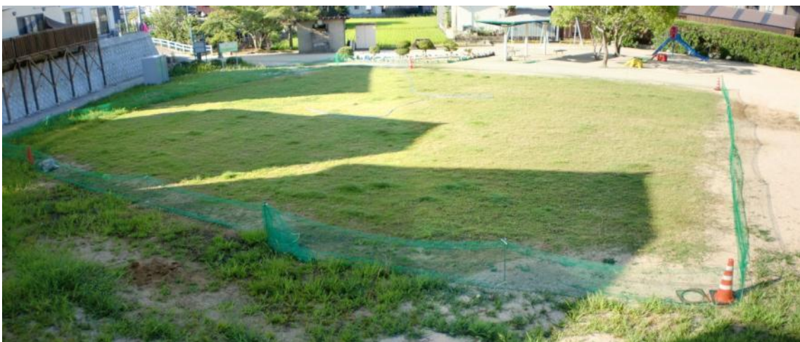
70日経過（平成22年8月下旬撮影） そろそろ2回目の芝刈りをする時期になりました