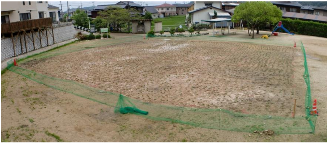
植付け完了（平成22年6月19日撮影） 作業を開始して約30分、植付けが完了 さすが100人のマンパワー