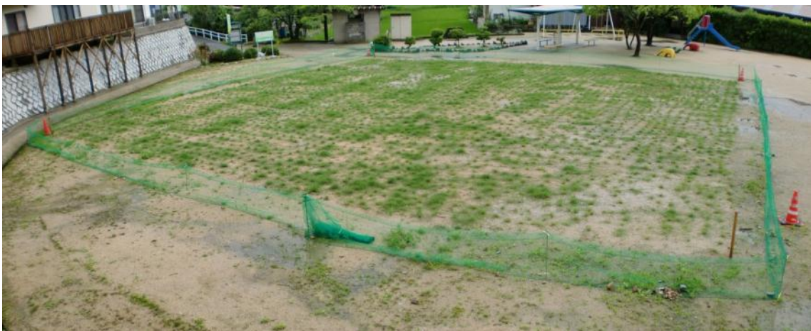
20日経過（平成22年7月上旬撮影） 遠くからみても変化が確認できるようになりました