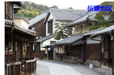
竹原の知名度を高め、市外からの誘客促進をさらに進める観光プロモーション事業