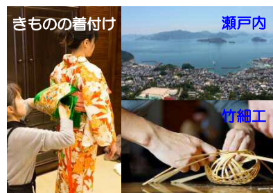
瀬戸内の自然や竹原の文化を体験できる新たな観光体験事業の開発