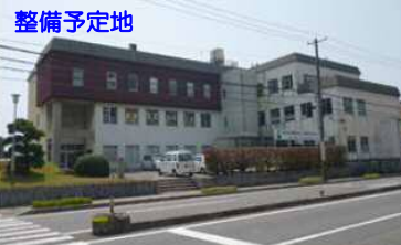
地域経済イノベーション活動拠点（まちおこしセンター）整備