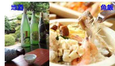
竹原の魅力を活かした特産品づくりなどの地域ブランドの開発