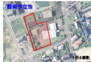
良好な居住環境を創出する認定こども園整備