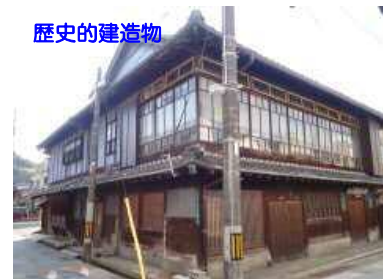
歴史的建造物をハイエンドな宿泊施設・飲食店へリノベーション