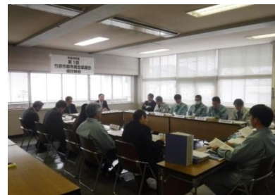
第1回都市再生協議会検討部会