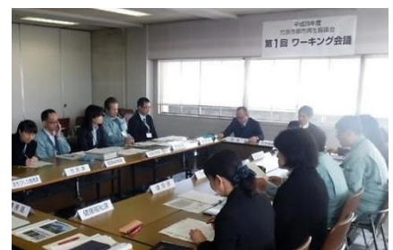
第1回都市再生協議会ワーキング