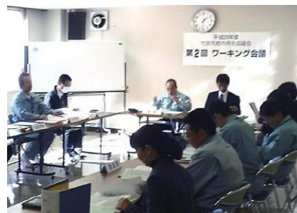
第2回都市再生協議会ワーキング