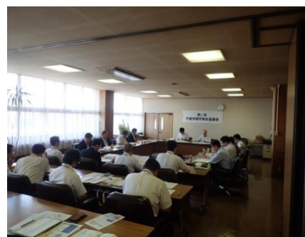
第2回都市再生協議会