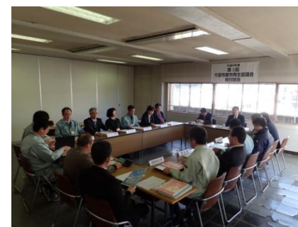
第3回都市再生協議会検討部会