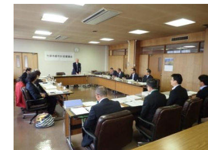
竹原市都市計画審議会【中間報告】