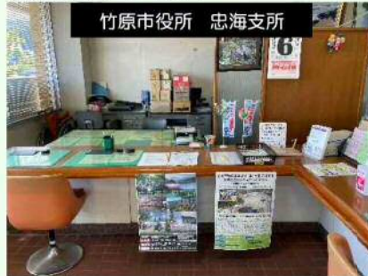
竹原市役所 忠海支所