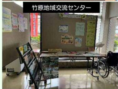
竹原地域交流センター