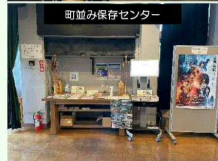
町並み保存センター