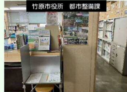
竹原市役所 都市整備課