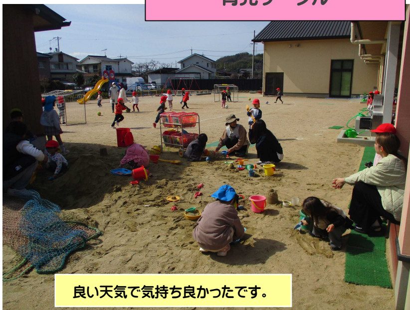
良い天気気持ち良かったです。