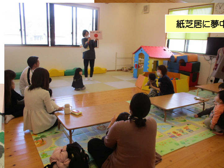
おやつの時間には保護者間の交流も。