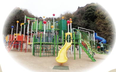
▲ピースリーホーム バンパー総合公園

●ここに紹介している公園以外にも竹原市内には たくさんの公園があります。みなさんもさがし てみてくださいね!!