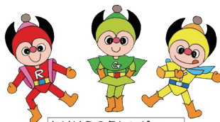
たけはら3色レンジャー