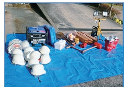
防災資機材の整備