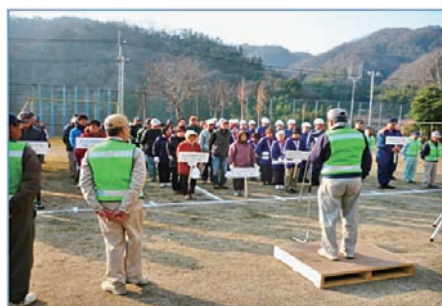
第2回自主防災訓練（H23.1）