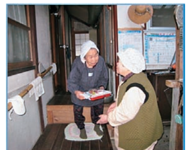
夕食弁当のお届け事業