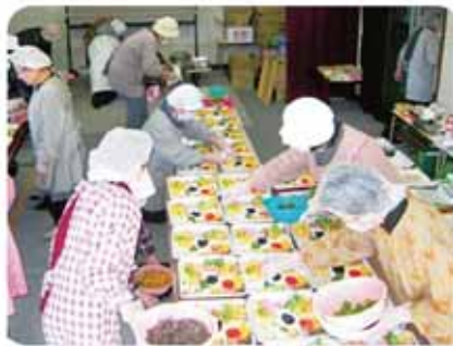
夕食弁当のお届け事業