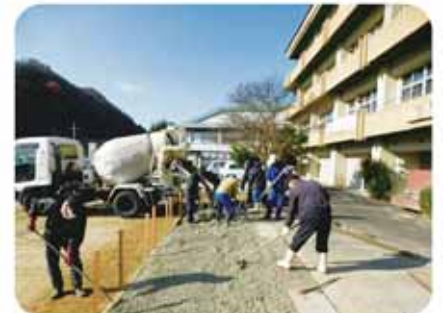
スポーツ広場整備