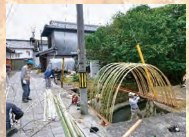
水路へ竹アーチの製作