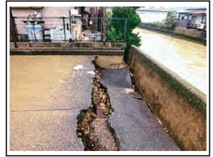
平成30年7月豪雨被害の様子