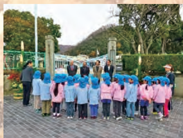
竹原西幼稚園の門松製作