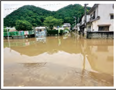
平成30年7月豪雨被害の様子