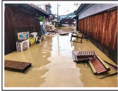
平成30年7月豪雨被害の様子