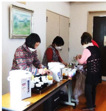
社協・民生・センター共催事業