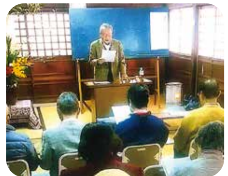
地域ふれあい交流会