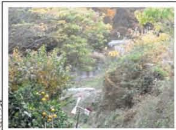
昭和42年頃 土砂崩れが発生。この谷を土砂が流れ落ちた。