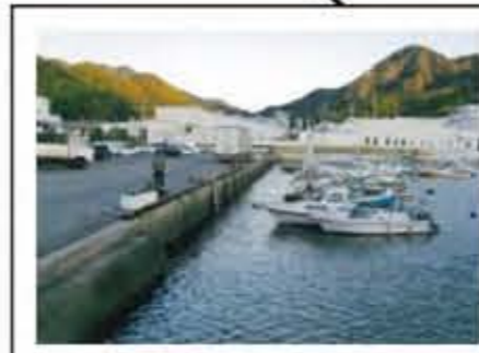
平成22年11月 台風等の影響で浸水する可能性が高い。土のう積みだけでは対応できない。