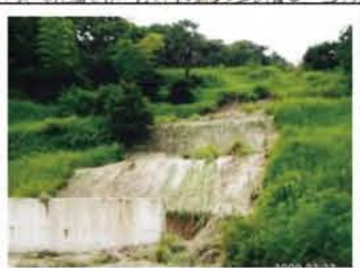
平成21年7月 豪雨による耕作放棄地の決壊

※○印は、対応災害で避難所として利用することが可能な場所となります。ただし、災害の規模や複合的な災害等によっては、利用できない場合があります。 ◎印は地盤の高い避難所です。