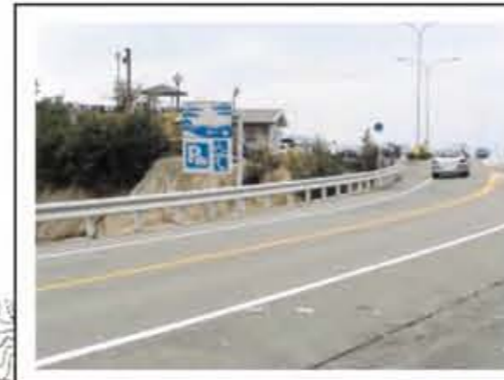
平成5年 台風の影響で国道185号沿いの山の斜面(現パーキング・エデン)が崩れ落ち、尊い命が奪われた。

この地図は、台風による高潮で忠海地区において、浸水被害を受けた区域、モデル台風により想定した区域、避難所を示したものです。 また、避難する場合の参考に土砂災害危険箇所を示します。