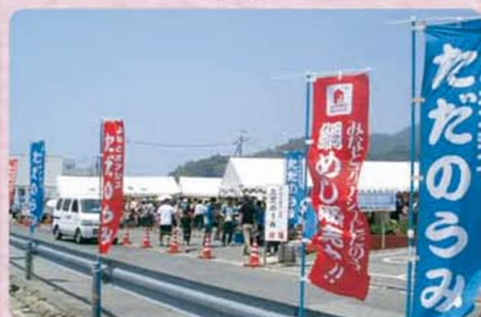
みなとオアシスただのうみ