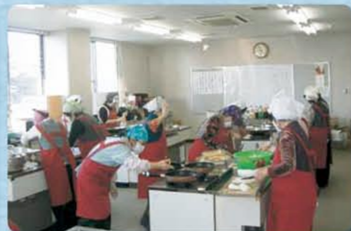
一人暮らし配食サービス