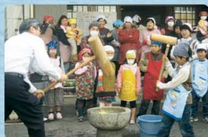
忠海公民館 ふれあい講座