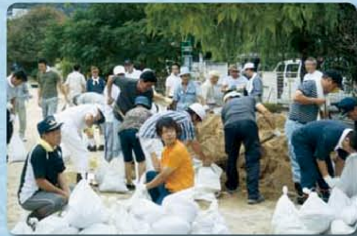
台風に向けた土のうづくり