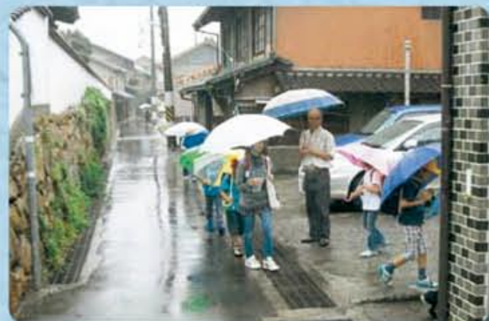
小学生登下校見守り活動