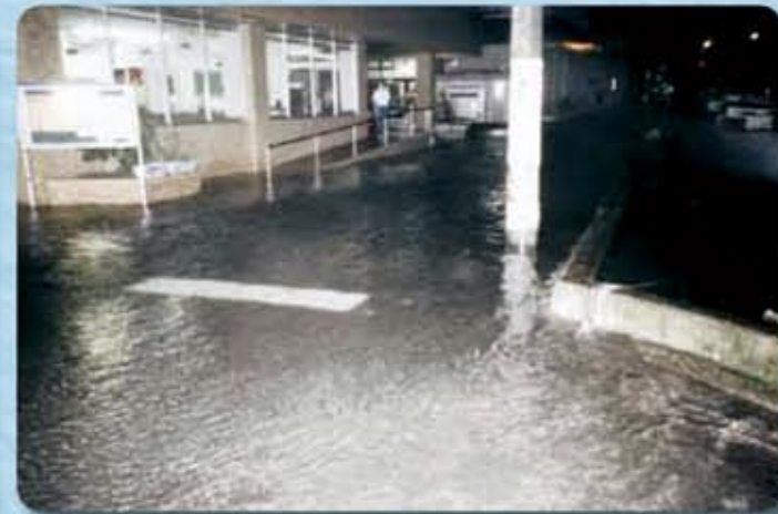
平成16年 台風16号 忠海支所前冠水状態