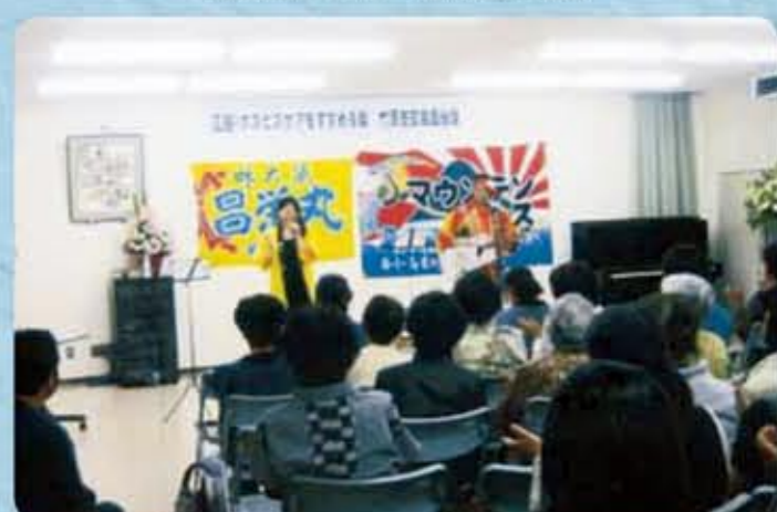
忠海福祉の駅 ホスピスケアをすすめる会講演会