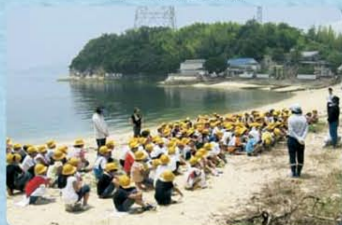
忠海西小学校 宮床海岸清掃