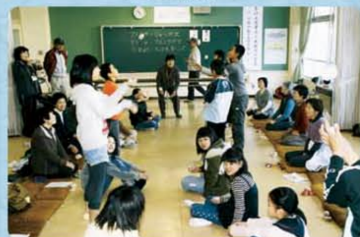
忠海西小学校 老幼交流会