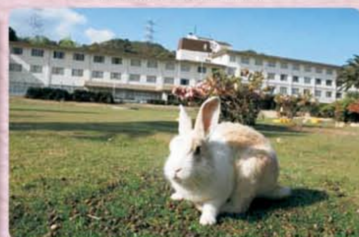
うさぎの島 休暇村大久野島