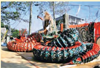
源義経を祀る「九郎神社」の大祭