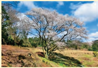
市重要文化財に指定された 「宿根の大桜」