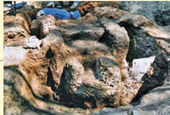
小早川隆景が秀吉に 鉄を献上していた 「東永谷製鉄遺跡」