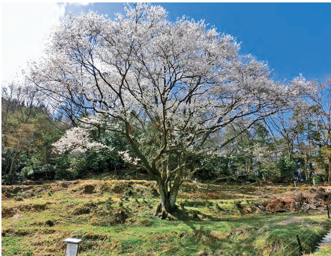
H26. 4 竹原市重要文化財指定「宿根の大桜」

～“ありがとう、すみません、おかげさま”人にやさしいまち～ みんなで一緒にやろうや！