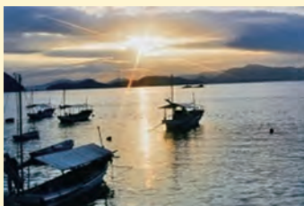
2億年前のロマンを秘めた 瀬戸内の美しい「築地海岸」