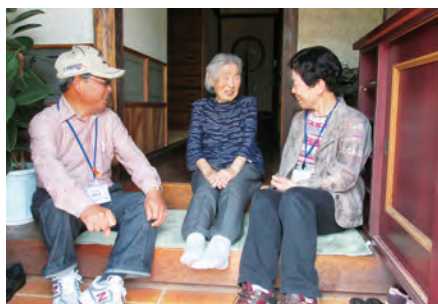
お助け声かけ隊 (高齢者宅への訪問)