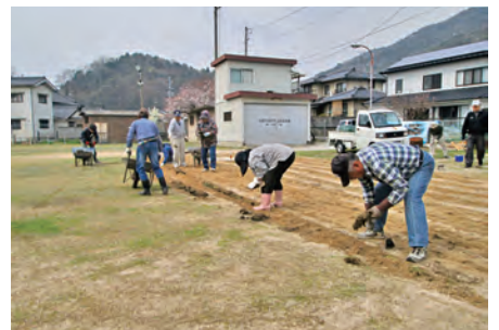
憩いの広場の芝生化