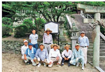
九郎神社への説明板設置