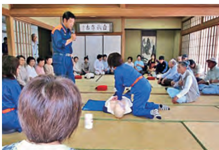
総合防災訓練（応急救命）