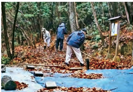
東永谷製鉄遺跡の保存活動