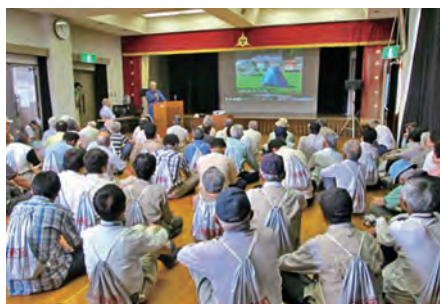
総合防災訓練（体験発表）