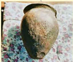
宿長谷遺跡から出土した 「弥生土器」