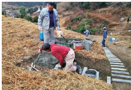
宿根の大桜の歩道整備