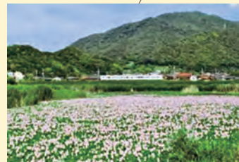
自然が残り野鳥や植物の 楽園「天池」