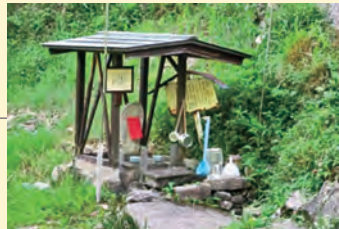
何年もの間、道行く 人の水飲場 「長寿の清水」