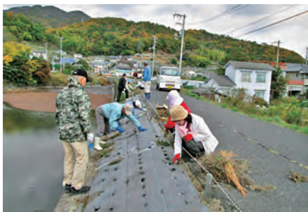
天池土手芝桜の植付け