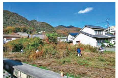
耕作放棄地の草刈り