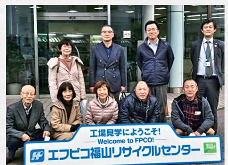
工場見学ようこそ! Welcome to FPCO!