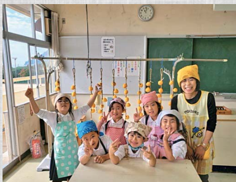
小学校1年生と干し柿作り