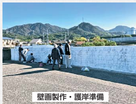
壁画製作・護岸準備