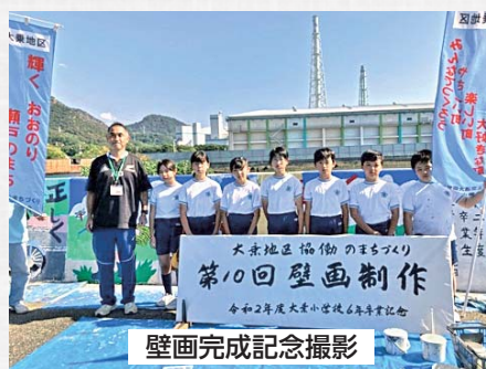
壁画完成記念撮影