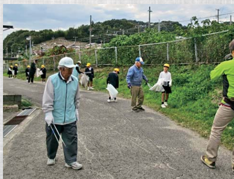
小学生とクリーン活動

現、大乘ハイツ 西側斜面より撮影 旧大乘中学校・大乘駅舎・ 国道185号線の風景