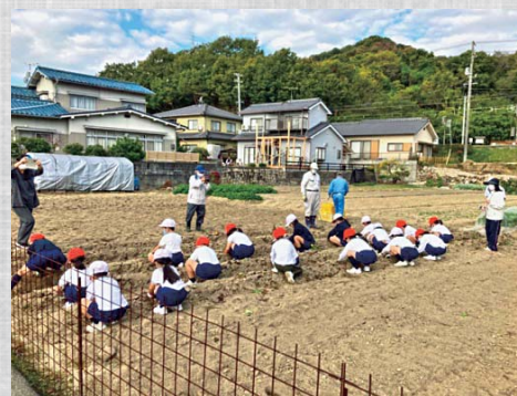
小学校1・2年生といも掘り体験