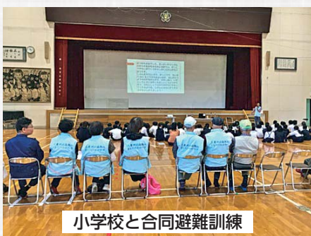
小学校と合同避難訓練