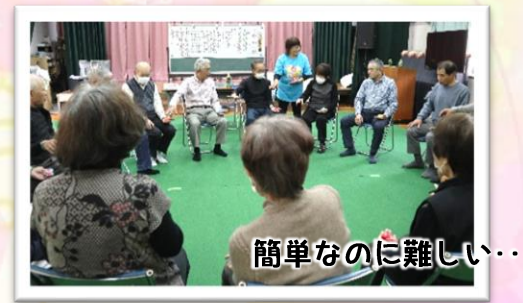
簡単なのに難しい・・・