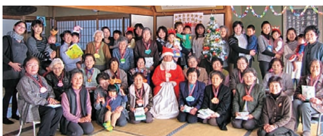
寿和会&すくすく会