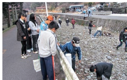
在屋川河川清掃活動