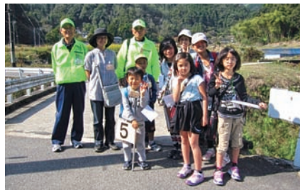
ひがしのキッス（東野探検）