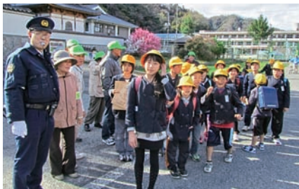
下校時見守り活動