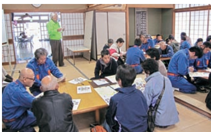
防災マップづくり会合