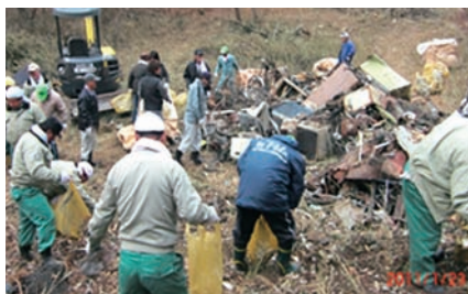
不法投棄撤去作業