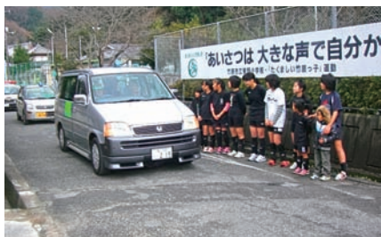
青色回転灯見守り活動

※ふりかえりの内容は、「○」はよかったことや成果を、「△」は反省することや課題を掲載しています。