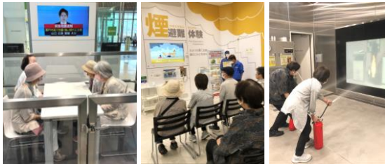
恐ろしかった地震体験↑煙り体験の説明を聞いてイザ煙の中へ↑ 消火は火元をねらって!

午後から予定していた「錦川とことトレイン」は機材の故障のため乗車できませんでしたが、代わりに「やまだ屋 おおのファクトリー」で参加者同士、楽しい時間を過ごし、地域の親睦を深めました。