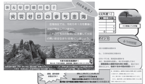
▲掲示中のポスター

12月6日には700日、令和7年1月7日には2年間火災ゼロとなります。竹原市全体での火災予防にも引き続き取り組み、みんなで「火災ゼロ」を継続しましょう！