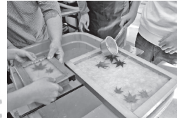
▲手すき和紙作り (大竹市)

広島、山口、島根の3県30市町で構成する広島広域都市圏。それぞれのまちの魅力を体験してみませんか。