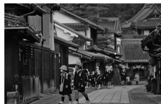
第31回景観づくり大賞 優秀賞「町並の日常」