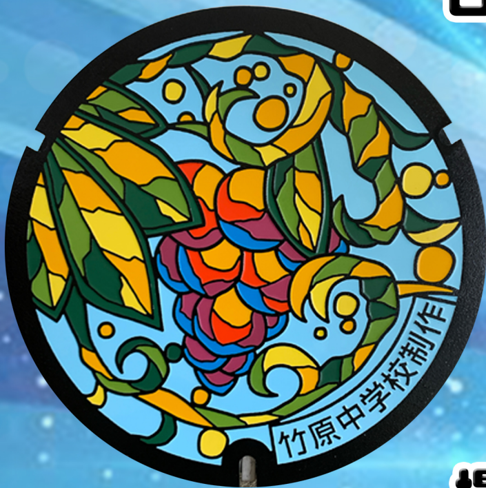
竹原中学校製作マンホール