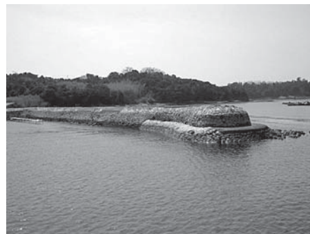
大多府漁港元禄防波堤