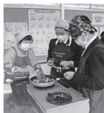
賀茂川中学校 自作弁当