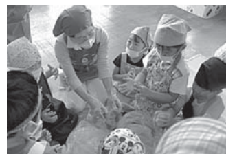
吉名こども園 手作りみそづくり