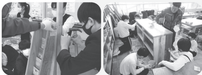
●県産材を使用した木製品を制作しました

竹原市では、市民の皆さまから納めていただいている「ひろしまの森づくり県民税」を財源として、森林の公益的機能（洪水や土砂崩れ等を防ぐ機能）を最大限発揮するため、人工林・里山林の整備や子どもたちの森林体験学習の支援など、県民参加の森づくりを推進しています。