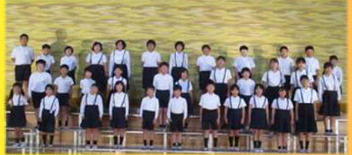
吉名学園合唱部 「緑の虎」も歌います!

G7広島サミットのパートナーズ・プログラムで演奏された曲「We love the EARTH from HIROSHIMA」を、吉名学園合唱部の児童の皆さんの歌声とともに披露していただきます。