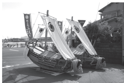
▲ホーエンヤ祭の船御輿

※9月8日(金)から10月11日(水)まで、旧森川家住宅では北前船日本遺産認定を受けている中国・四国地方の自治体を紹介するパネル展を開催しています。