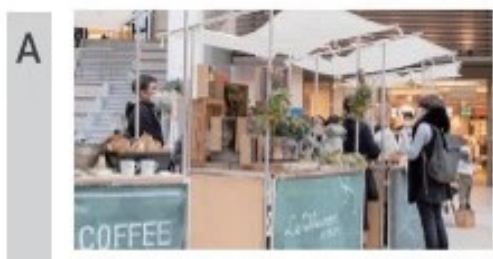
A マルシェエリア にぎやかな屋台が並び、雑材を使ったバスケースづくりのワークショップも開催されます。

腰を下ろしておしゃべりしたり その日の出会で買い物したり 温かいコーヒーを飲みながら 自分なりの楽しみ方で 駅の「待ち」時間を過ごし たけはらの「街」の魅力に出会える マルシェを開催します。