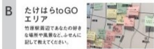
B たけはらtoGO エリア 竹原駅周辺であなたの好きな場所や風景など、ふせんに記して教えてください。