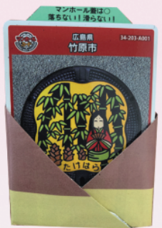
マンホールカードを 入れたら完成です。