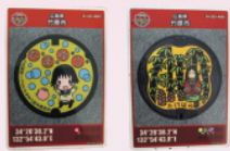
マンホールカード

マンホールカード配布時にお渡しします「お守り台紙」を思いを入れて 折っていただき、マンホールカードをお守り袋の中に入れていただければ 「マンホールカード・お守りバージョン」の完成です。