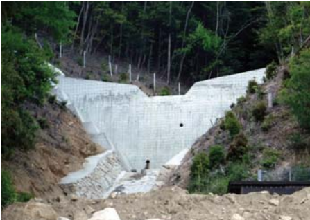
▲本提施工完了(株浜本組)