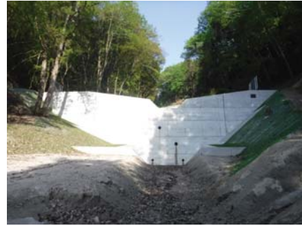
▲本提施工完了(株千田)

緊急治山事業は、災害により発生したなだれ発生地について緊急に堰堤や山腹工の整備を行うことで荒廃山地の復旧を行います。仁賀町光時地区でも土石流が発生しましたが、緊急治山事業で堰堤が完成しました。