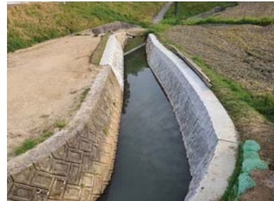
▲工事完成(施工:株渡橋組)