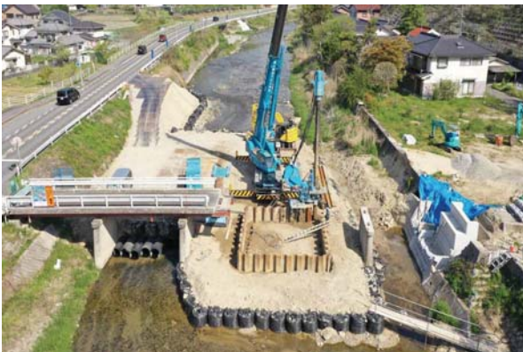
▲橋脚基礎施工中(施工:沖元土建(株))

東野町の賀茂川に架かる水ノ口橋は、先の豪雨で橋脚を流失したことから、復旧工事を行っています。現在、基礎と橋脚の築造工事を進めています。