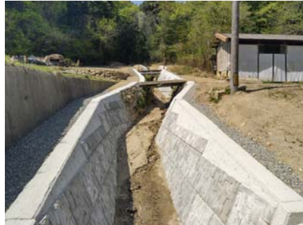
▲工事完成(施工:株岡組)