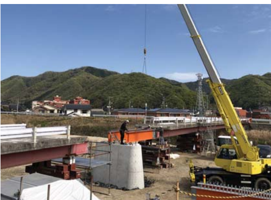
▲主桁架設中(施工 株保手濱建設)

下野町成井地区の賀茂川に架かる上成井橋は、基礎と橋脚築造が完了し、主桁架設や床版工、防護柵工事など上部工を進めています。