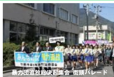
暴力団追放総決起集会 街頭パレード