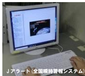
Jアラート（全国瞬時警報システム）