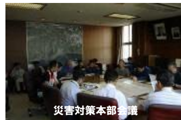
災害対策本部会議