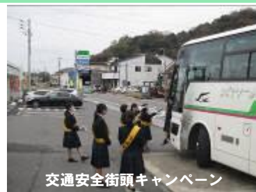
交通安全街頭キャンペーン