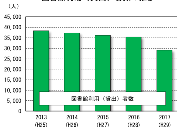
図書館利用（貸出）者数の推移