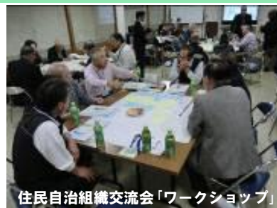
住民自治組織交流会「ワークショップ」