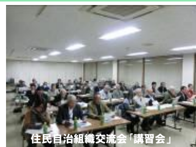
住民自治組織交流会「講習会」