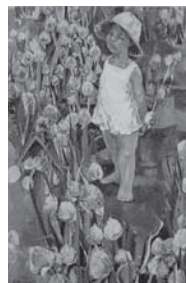
▲安森 征治 「清気」