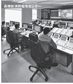
高機能消防指令センター

平成21年4月1日から竹原市、東広島市、大崎上島町からの119番通報は、東広島市の東広島市消防局指令課につながり、かけている場所がモニターに表示されるようになっていきます。