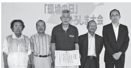
大乘自然環境を守る会のみなさん(代表者)

平成17年度に設立後、計108回の不法投棄監視パトロールの実施や計13,815kgの不法投棄の回収を実施したこと及び町域を越えて県・市・三原市と合同でパトロールを実施したことなどが評価されました。