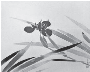
◀ 森 白甫 「杜若」