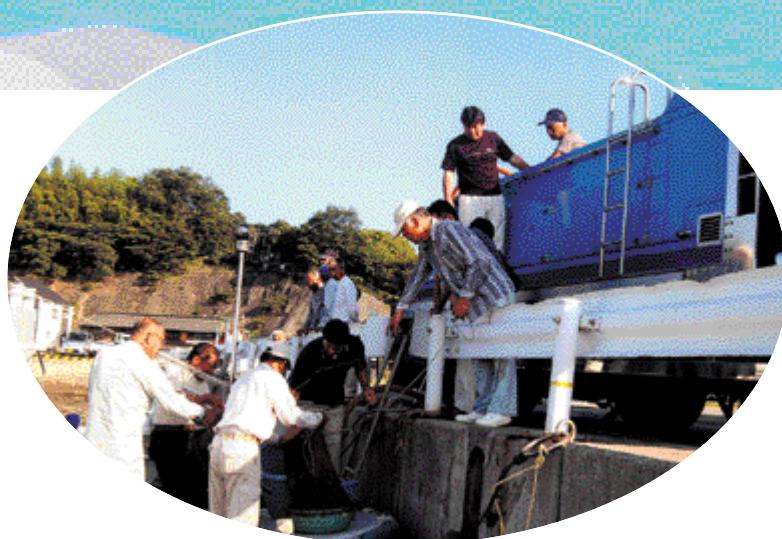
稚魚放流事業の様子（7月24日 竹原港明神棧橋附近）

9月14日からの予定は、 9月定例市議会を、 みなさん、市議会を、 傍聴しましよ。