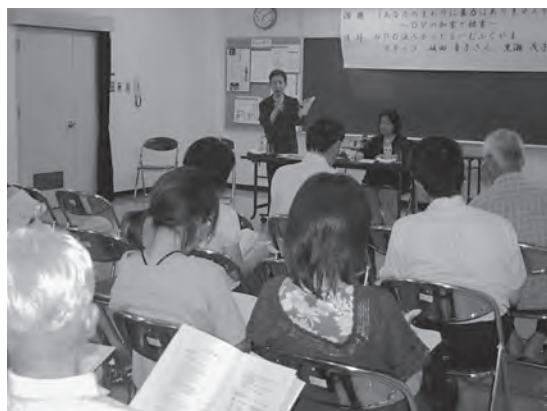
人権啓発講座の様子

切な存在です。差別の現状を正しく知り、差別を見抜く力をつけ、すべての人が住んでよかつたと思えるまちづくりを積極的に進めましょう。