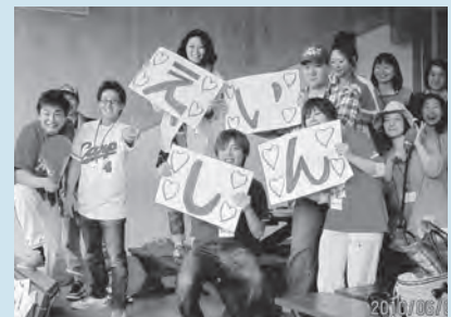
カープ応援ツアーの様子